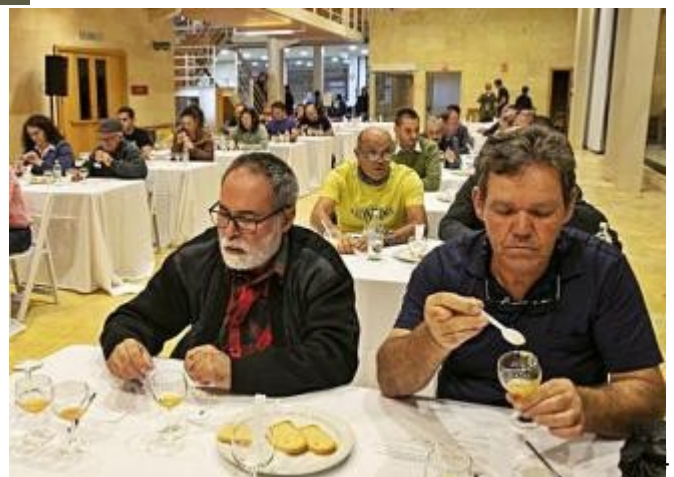
Instantánea de la cata de 2019