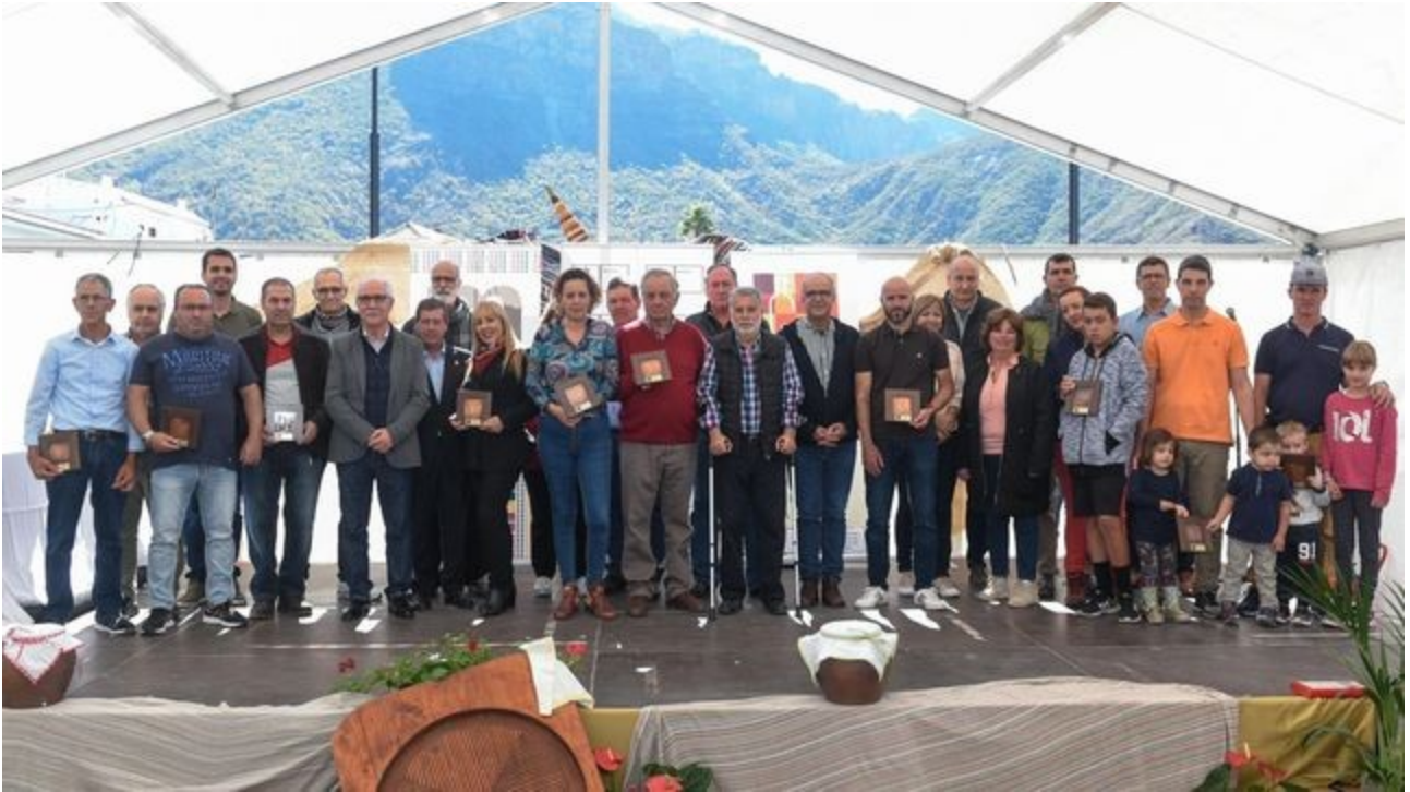
Ganadores XIII concurso Oficial de Mielles de G.C. 2018