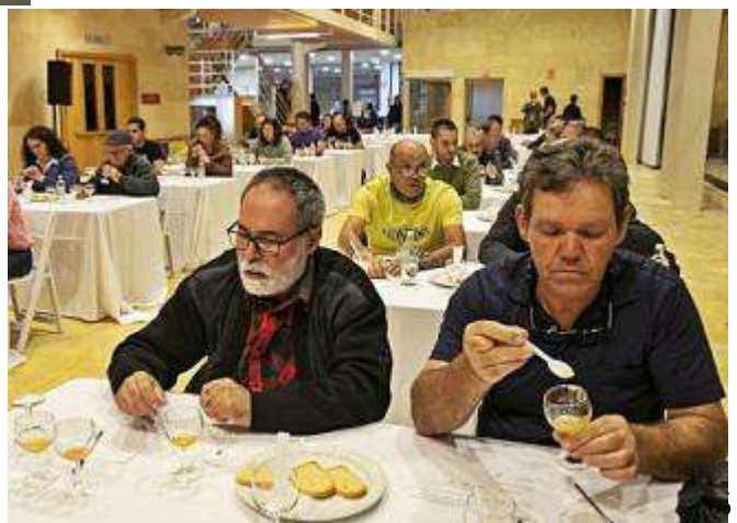
Instantánea de la cata de 2019