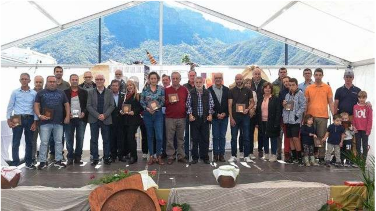
Ganadores XIII concurso Oficial de Mielles de G.C. 2018